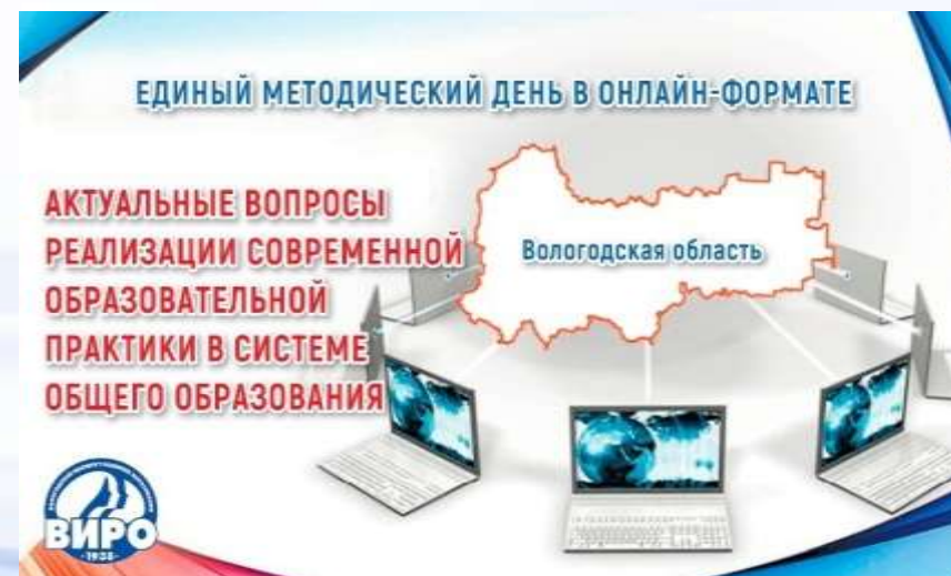
График проведения ЕМД на 2022-2023 учебный год (утвержден Приказом АОУ ВО ДПО «ВИРО» от 24.08.2022 г. №200-о)

График проведения ЕМД на 2021-2022 учебный год (утвержден Приказом АОУ ВО ДПО «ВИРО» от 01.08.2022 г. №185-о)