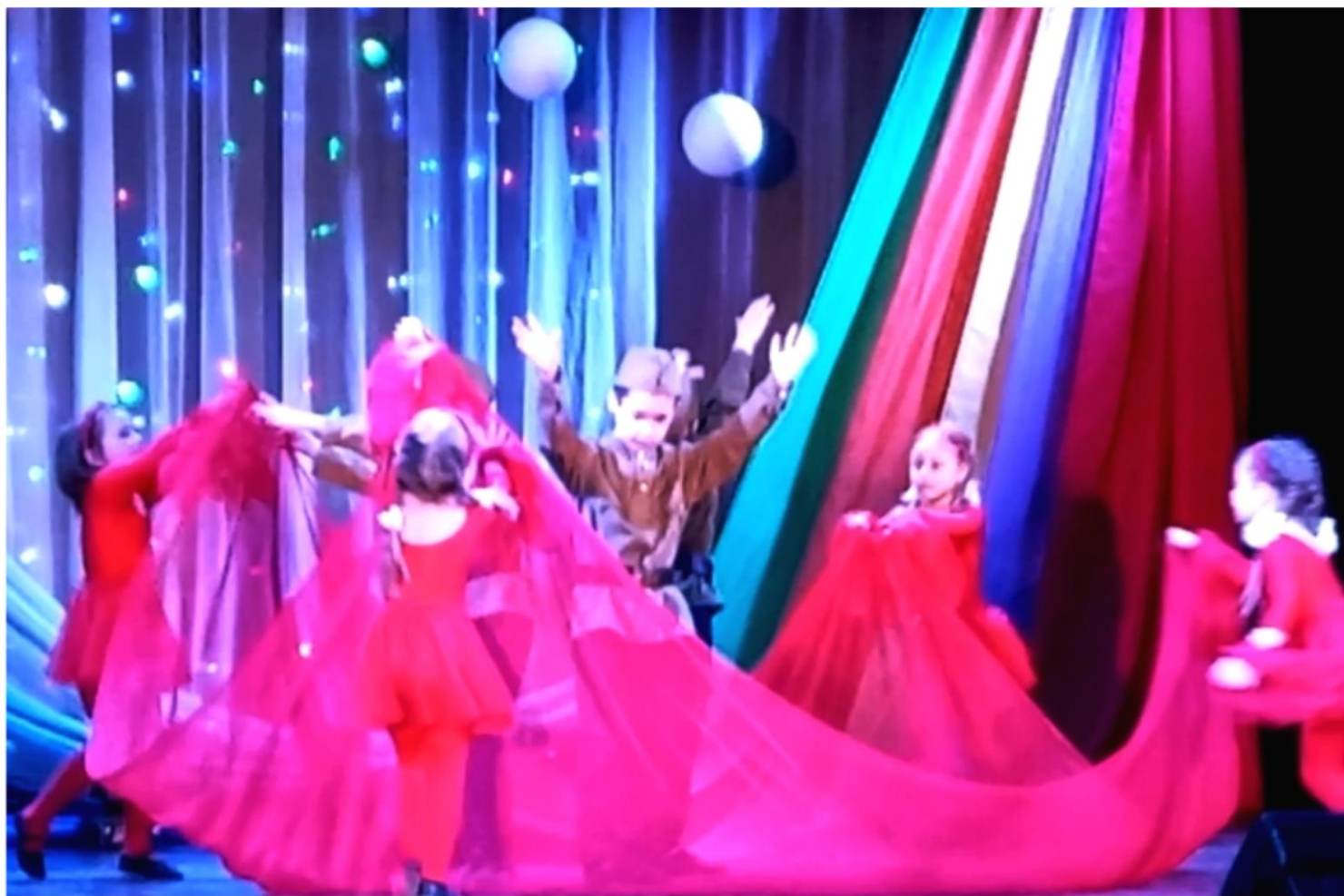
Концерта, посвященный Дню Победы в районном Доме культуры