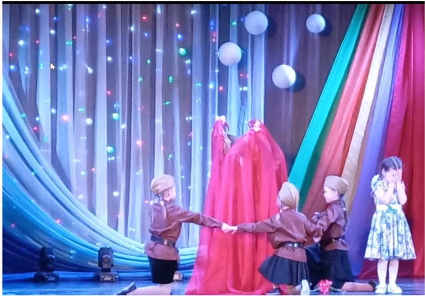
Дети активные участники концерта, посвященного Дню Победы в районном Доме культуры.