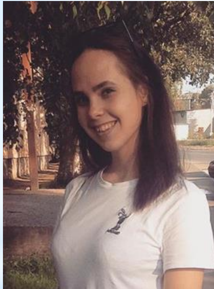
- молодой педагог