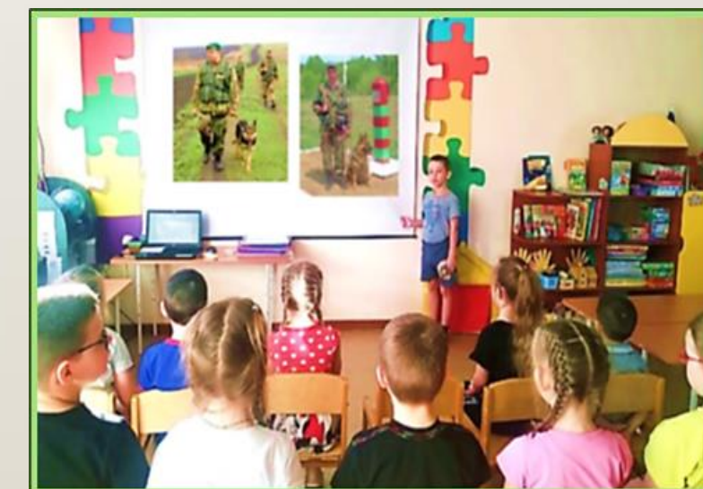
Фото 6, 7, 8 НОД по познавательному развитию на тему: «Кто охраняет наш покой?»

С целью формирования патриотизма у детей, уважительного отношения к защитникам нашей Родины прошла познавательная беседа на тему: «Защитник Отечества – кто же он?». В ходе беседы дети узнали, какими качествами должен обладать военный.