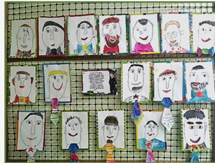
Фото 31 Выставка рисунков на тему: «Мой папа-защитник Отечества»

Особым украшением картинной галереи стала выставка рисунков на тему: «Мой папа-защитник Отечества». Экспонатами зала скульптур стала экспозиция: «Отважные десантники».