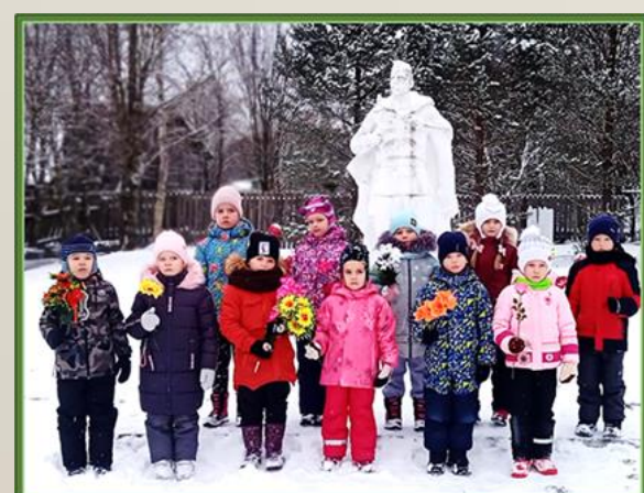
Фото 15, 16, 17 Целевая прогулка к памятнику «Неизвестного солдата»

В соответствии с планом взаимодействия с сотрудниками Вохтожского поселкового дома культуры были проведены игры на патриотическую тематику «Морской чемоданчик» . В ходе игр дети показали свою ловкость, смекалку и выдержку.