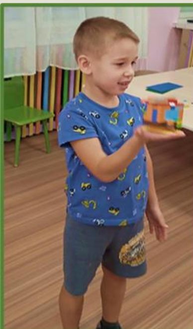
Фото 36, 37, 38, 39, 40 Конструирование на тему: «Воздушная техника»