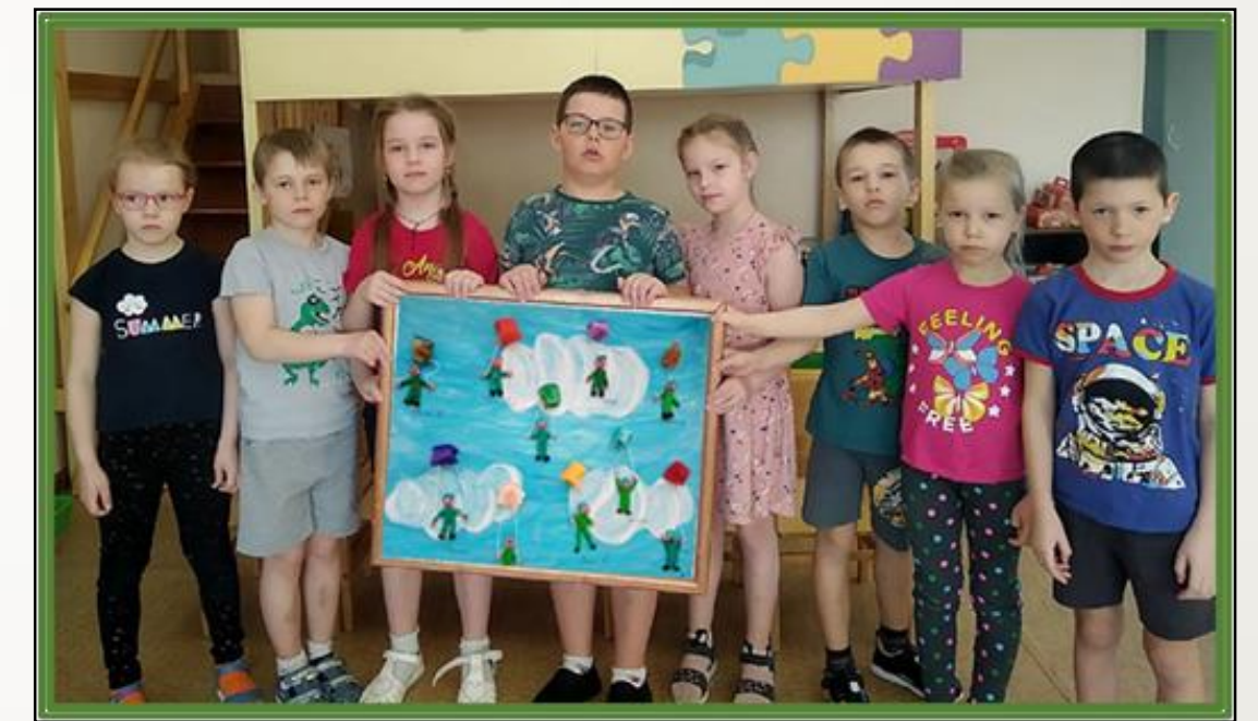
Фото 32 Лепка на тему: «Отважные десантники»

В зал боевой техники были помещены поделки по конструированию из лего - дупло, пластиковых материалов, бумаги и картона, с помощью, которых дети с удовольствием проигрывали различные военные ситуации.