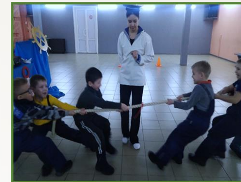
Фото 18, 19, 20 Игра «Морской чемоданчик»

Большое значение для формирования основ патриотизма у детей дошкольного возраста имеет совместная деятельность с родителями.