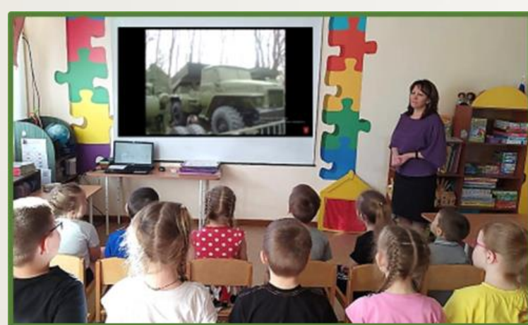
Фото 13, 14 Онлайн-экскурсия по музею военной техники Российской Армии

В рамках тематического дня «Имя твое неизвестно, подвиг твой бессмертен» в ходе различных мероприятий дети познакомились с историей памятной даты, узнали, что Неизвестный солдат – символ всех воинов, погибших на фронте. В память о них возведены памятники и горит вечный огонь – знак нашей скорби.