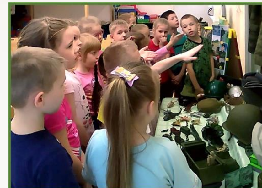
Фото 43, 44, 45 Интерактивная выставка, посвященная Дню защитника Отечества