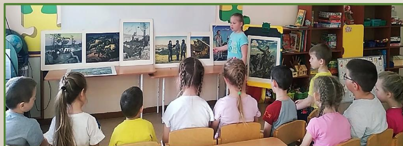
Фото 9, 10, 11, 12 Беседа на тему: «Защитник Отечества – кто же он?»