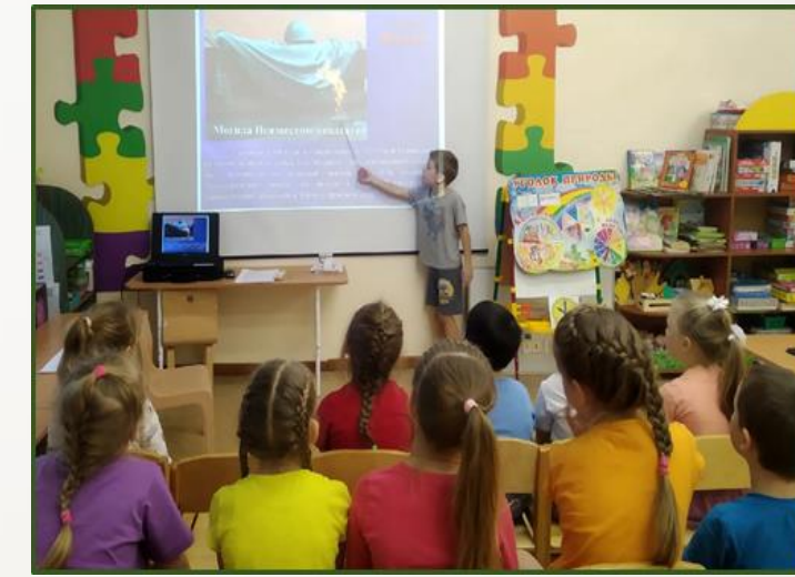
Фото 3, 4, 5 Беседа с детьми на тему: «История и традиции праздника»

Для формирования уважительного отношения к представителям вооруженных сил было организовано занятие по познавательному развитию на тему: «Кто охраняет наш покой?». В ходе занятия дети познакомились с понятием защитники Отечества, о людях, защищающих нашу страну. Дошкольники с большим интересом слушали о Российской Армии, о разных родах войск, о современном вооружении, об особенностях военной службы.