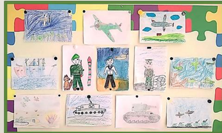
Фото 34 Рисование на тему: «Наша Армия»