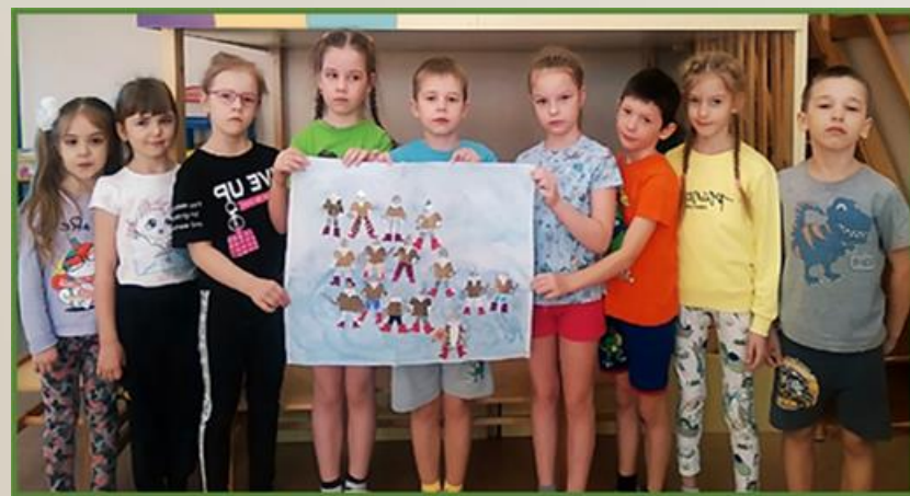
Фото 33 Аппликация коллективная на тему: «Тридцать три богатыря»