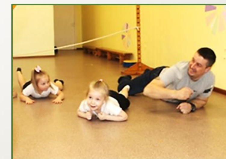
Фото 21, 22, 23 Военно - патриотическая игра на тему: «Мы защитники»

В ходе спортивного досуга «Школа молодого бойца» , который провел папа воспитанницы группы, служивший в войсках Военно-воздушных сил, девочки наравне с мальчиками с удовольствием участвовали в эстафетах и препятствиях настоящей армейской подготовки.