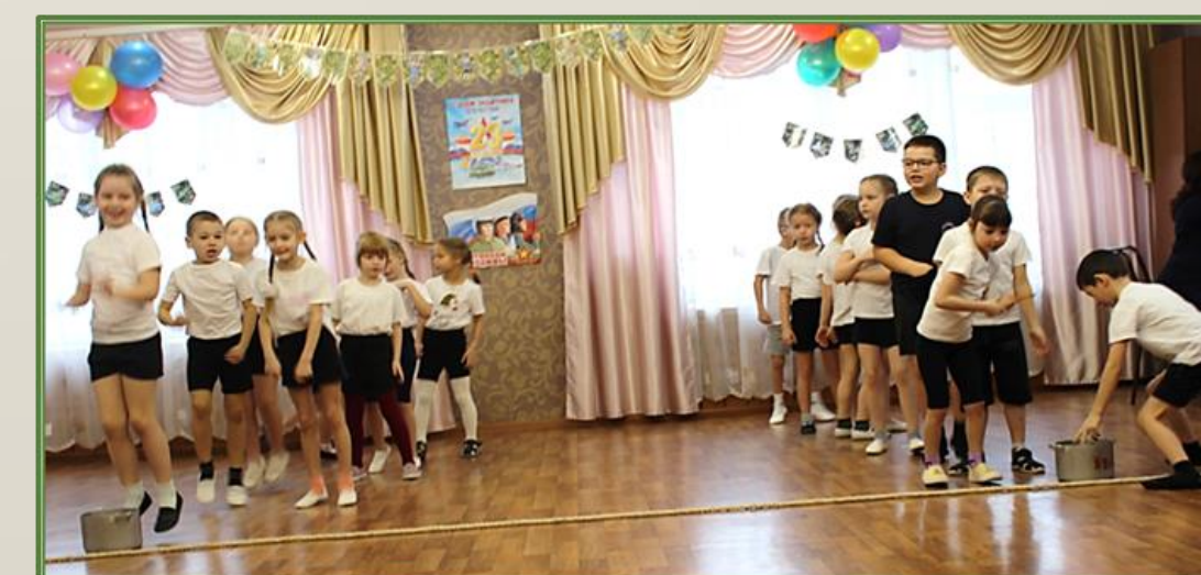
Фото 24, 25, 26 Спортивный досуг на тему: «Школа молодого бойца»