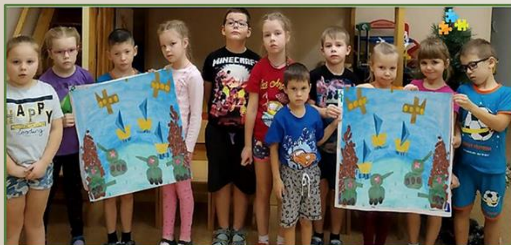
Фото 35 Аппликация коллективная на тему: «Военная техника»