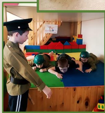
Фото 27, 28, 29, 30 Сюжетно – ролевая игра: «Будем в армии служить»