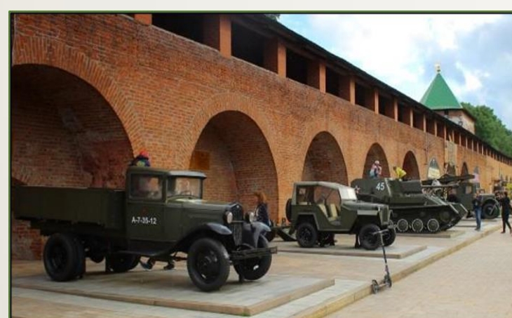
Фото 1, 2