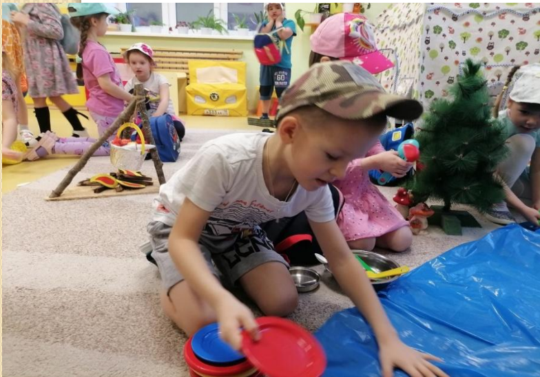
моем посуду после ухи