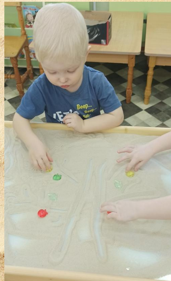
«Что растет на дереве?»