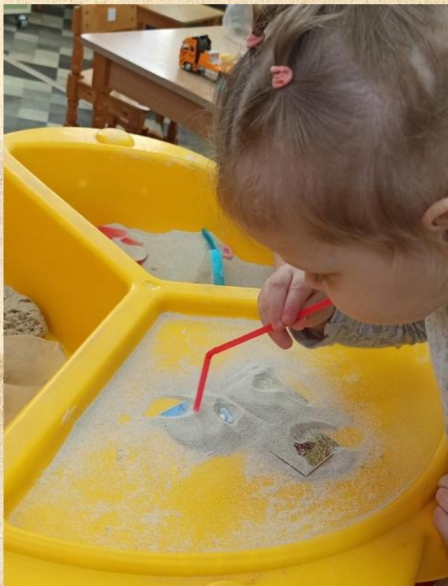
«Что спрятано в песке?»